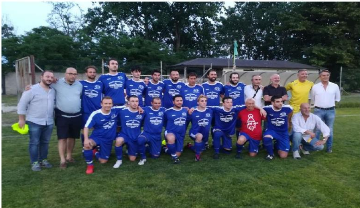
Fase Territoriale CSI Pavia 2022-2023 – 1 a classificata – TENNIS CLUB – Campione Provinciale