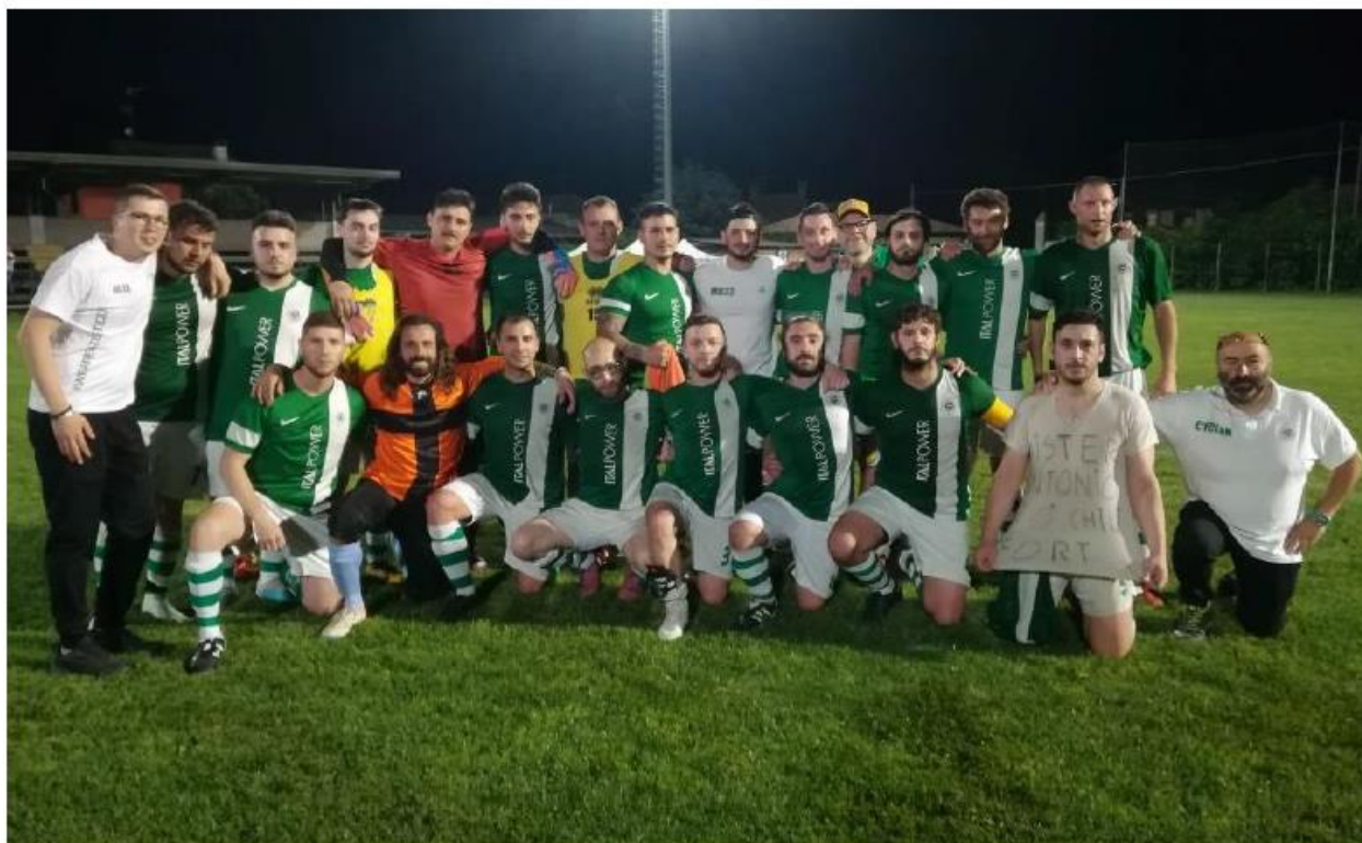
Fase Territoriale CSI Pavia 2022-2023 – 2° classificata – POL. ATLETICO ARLUNO