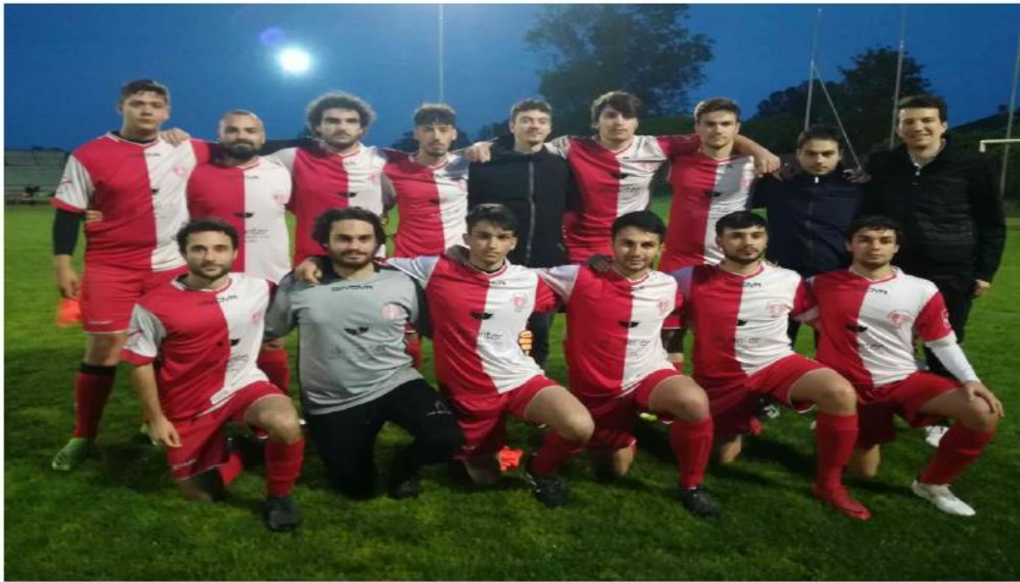
Fase Territoriale CSI Pavia 2022-2023 – 2° classificata – ORAT. SAN FRANCESCO SIZIANO