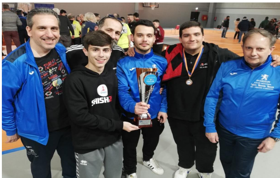
Gli atleti della ASD Oratorio Albuzzano Tennis Tavolo

Sulle 36 società partecipanti, l' Asd Oratorio Albuzzano Tennis Tavolo si è classificata 8 ^ , mentre la Polisportiva Miradolese 27 ^ .