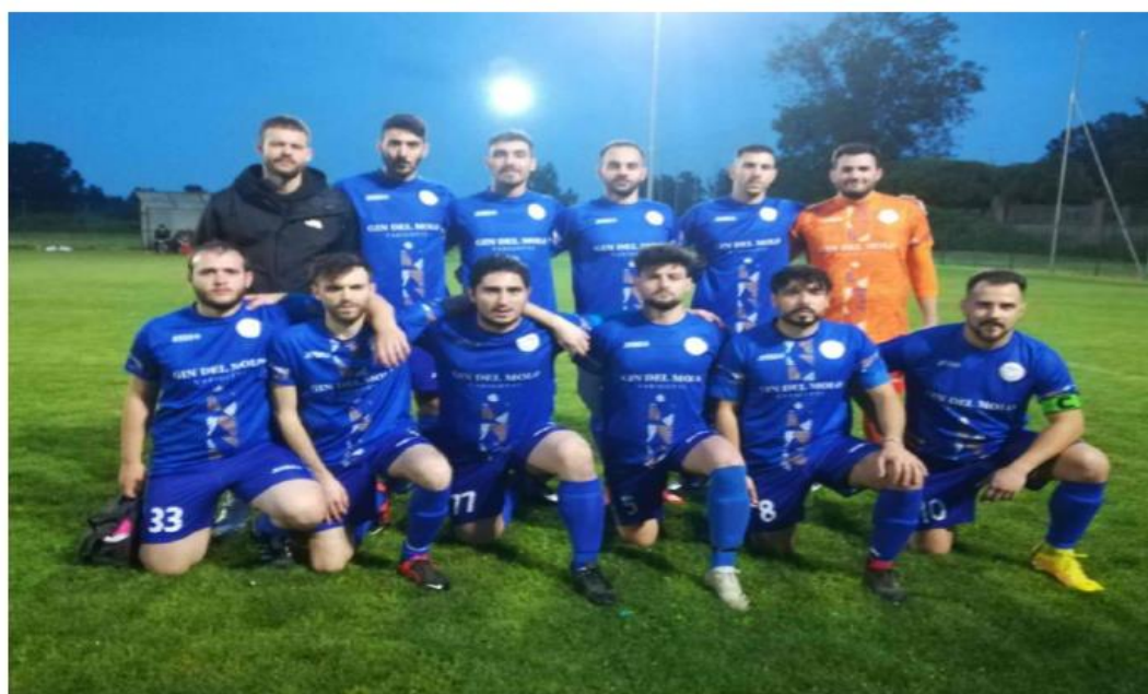
Fase Territoriale CSI Pavia 2022-2023 – 1° classificata – CASURA' – Campione Provinciale