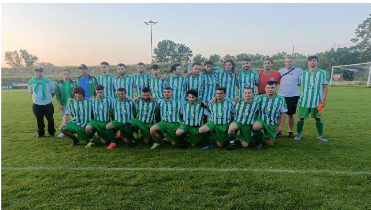
Coppa CSI Pavia 2022-2023 – 1° classificata – VAL VERSA