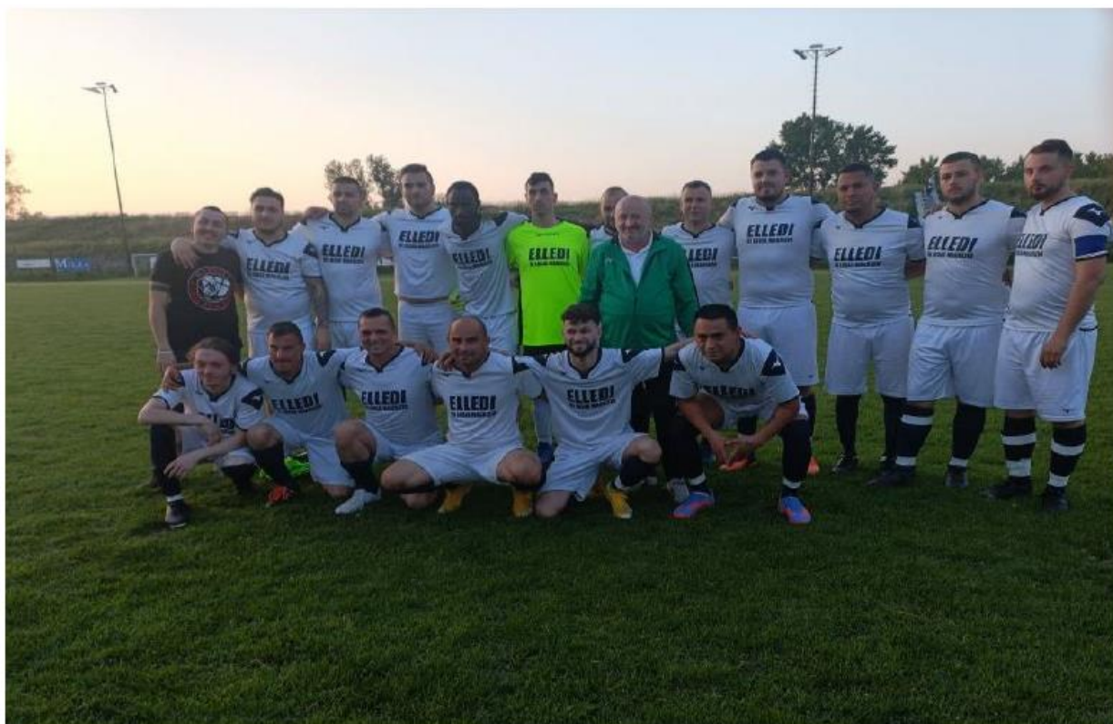
Coppa CSI Pavia 2022-2023 – 2° classificata – ELLEDI