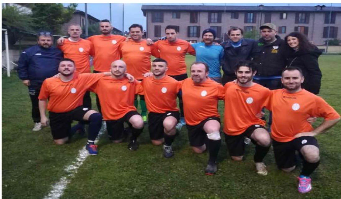
Coppa CSI Pavia 2022-2023 – 2° classificata – ROMAGNESE