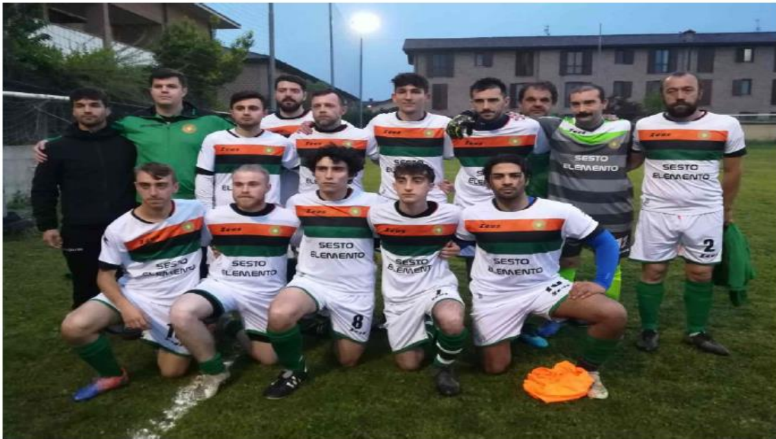
Coppa CSI Pavia 2022-2023 – 1° classificata – POL. MIRADOLESE