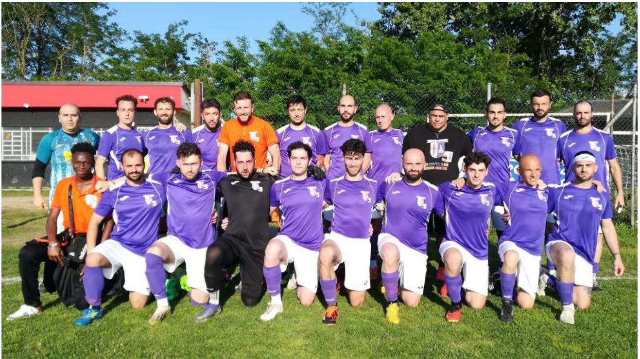
Coppa CSI Pavia 2023-2024 Open 11 - 1° classificata - GROPELLO SAN GIORGIO