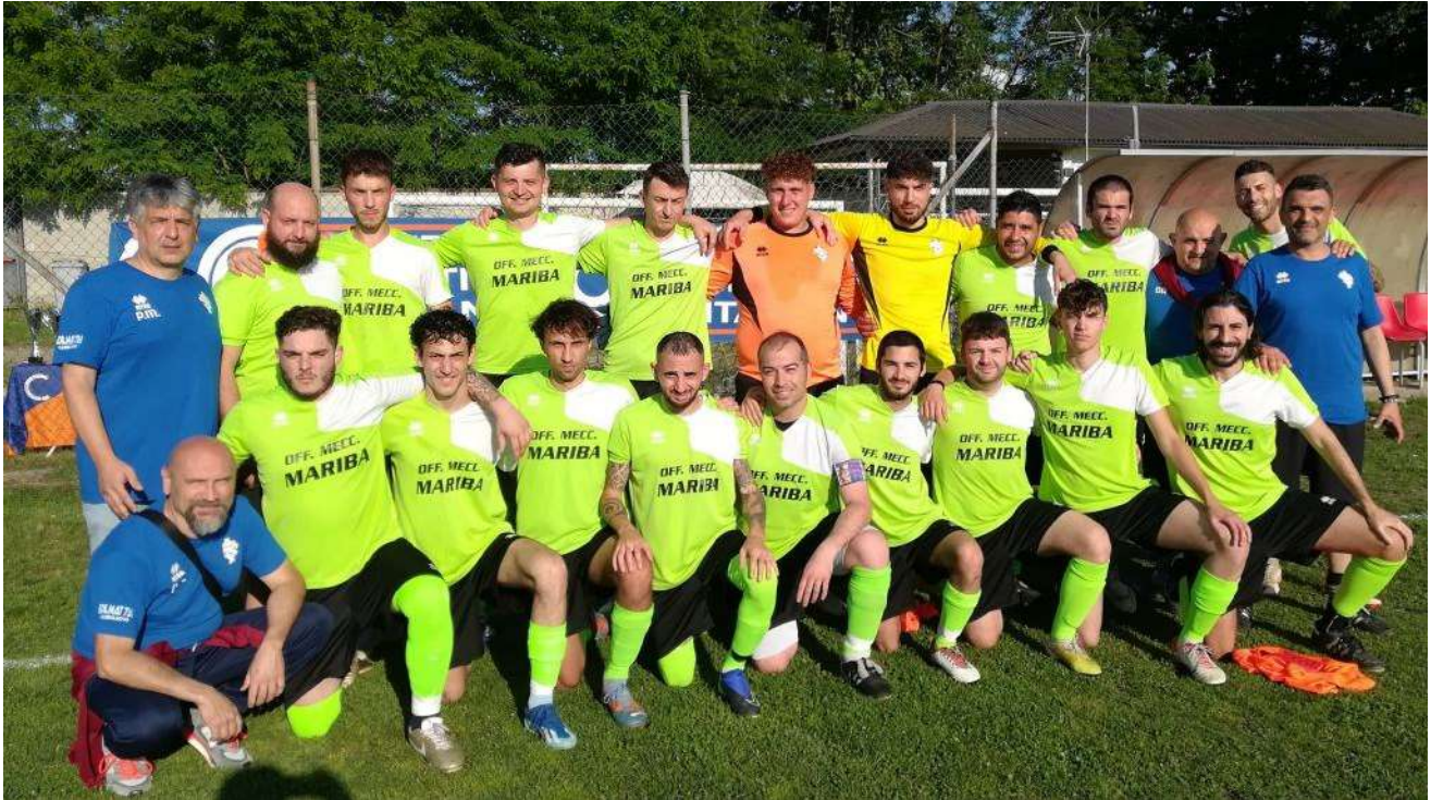
Coppa CSI Pavia 2023-2024 Open 11 - 2° classificata – CHICCO CIVITA