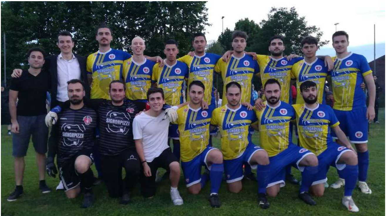
Fase Territoriale CSI Pavia 2023-2024 Open 7 - 2° classificata - OR. S. FRANCESCO SIZIANO