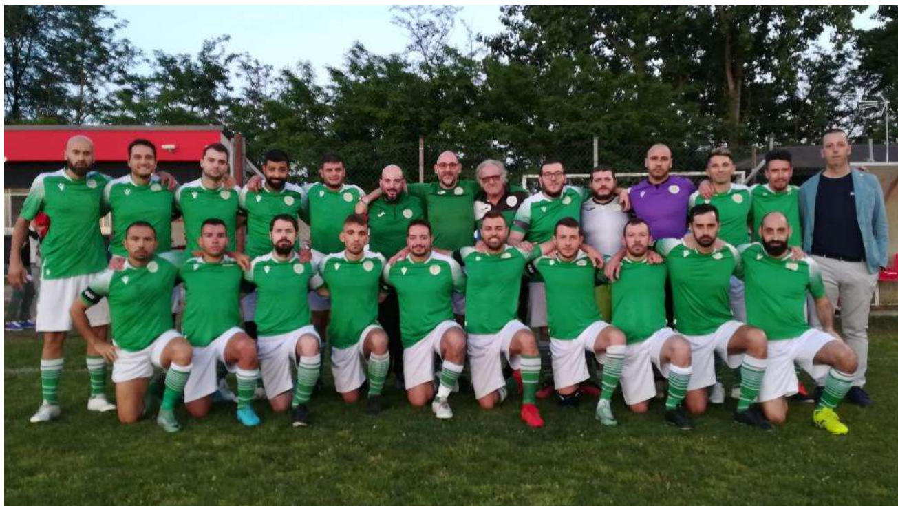
Fase Territoriale CSI Pavia 2023-2024 Open 11 - 1° classificata - CSR CUORE 1990 - Campione Provinciale