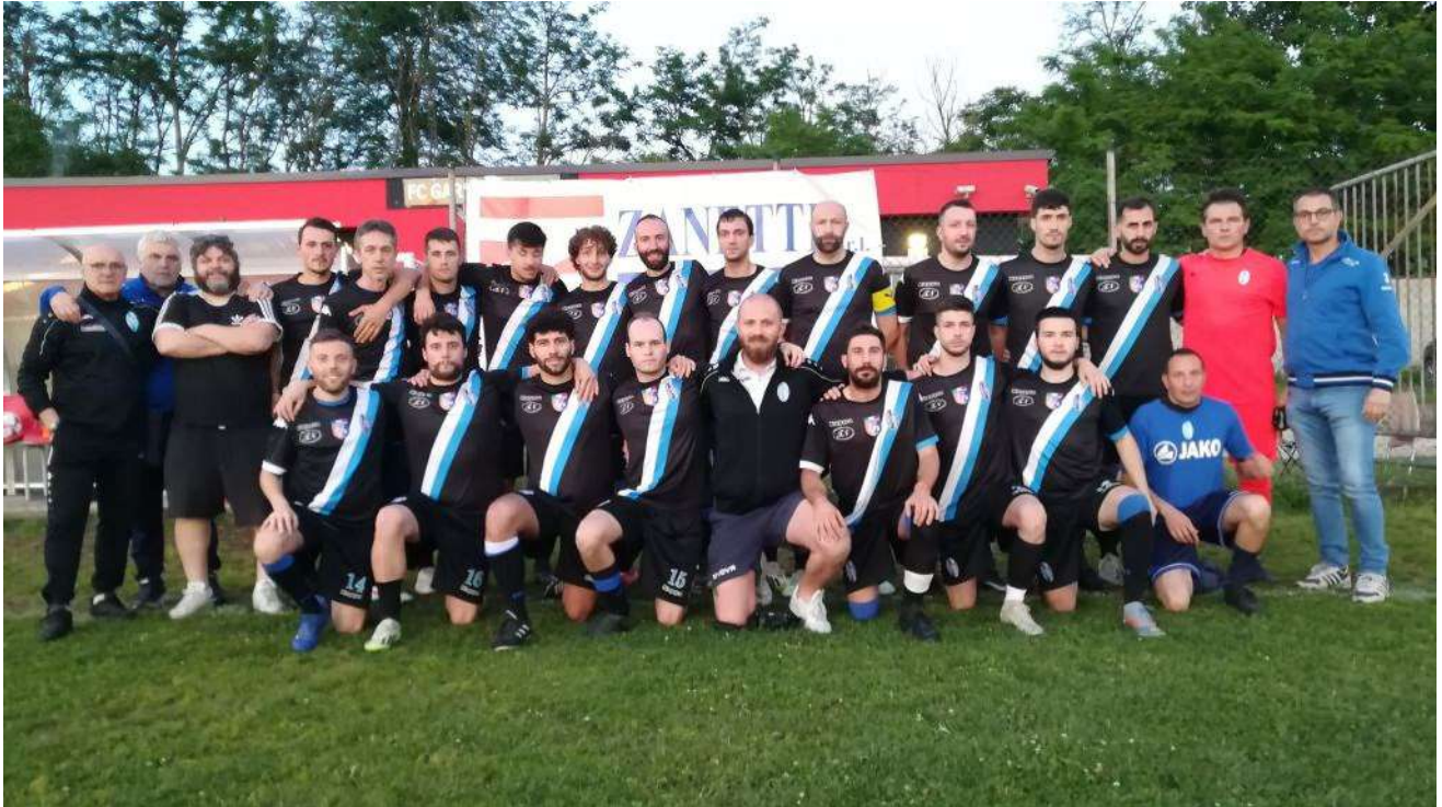
Fase Territoriale CSI Pavia 2023-2024 Open 11 - 2° classificata - FILIGHERA