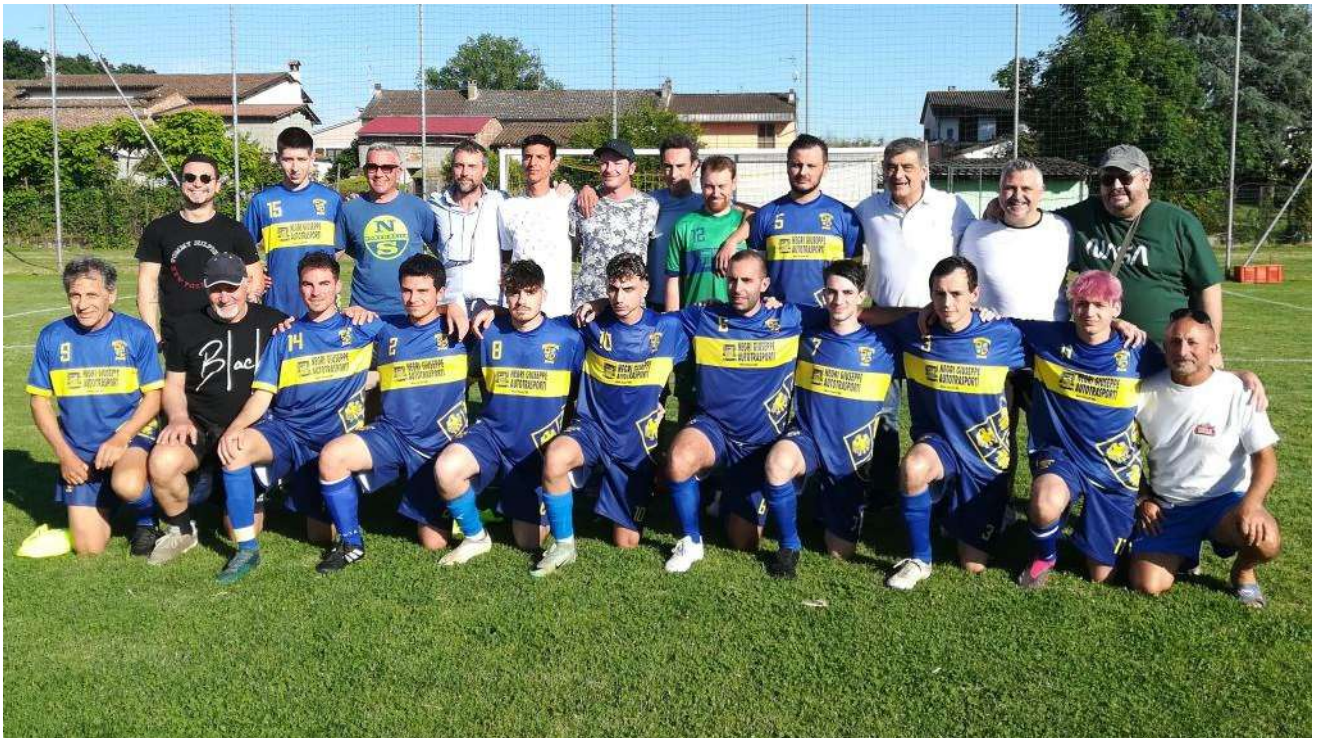
Coppa CSI Pavia 2023-2024 Open 7 - 1° classificata - PARASACCO