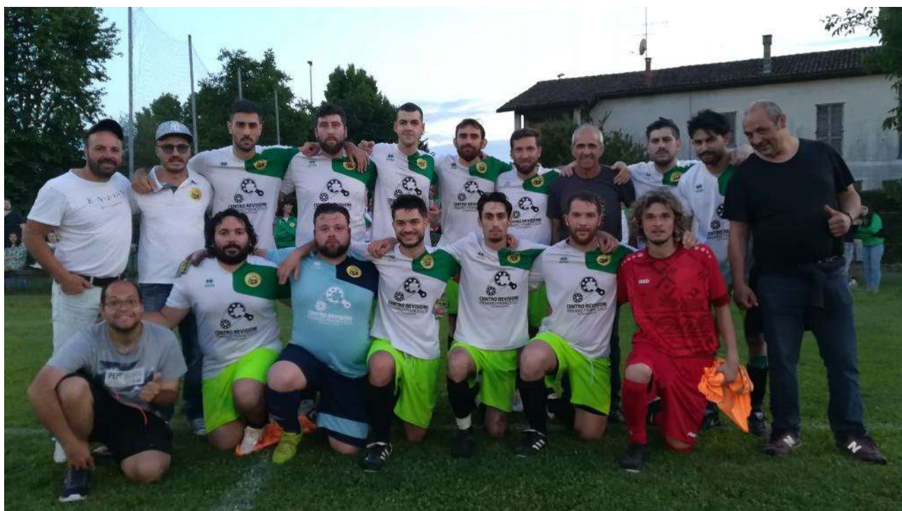
Fase Territoriale CSI Pavia Open 7 - 1° classificata - CASCINE CALDERARI - Campione Provinciale