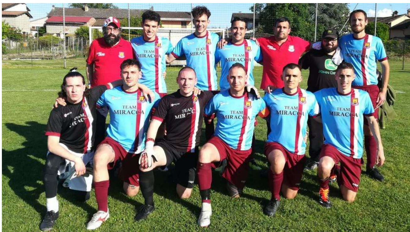
Coppa CSI Pavia 2023-2024 Open 7 - 2° classificata – O.S.R.P. CERTOSA