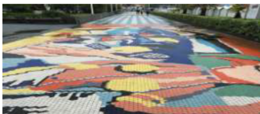
Albisola Marina "Lungomare degli Artisti"