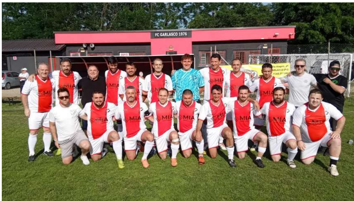
Campionato CSI Pavia 2025-2026 Open 11 - Coppa CSI - 1° classificata - LA MONICA CALCIO