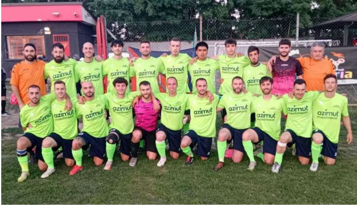
Campionato CSI Pavia 2025-2026 Open 11 - Campione Territoriale - ASD ROSASCO