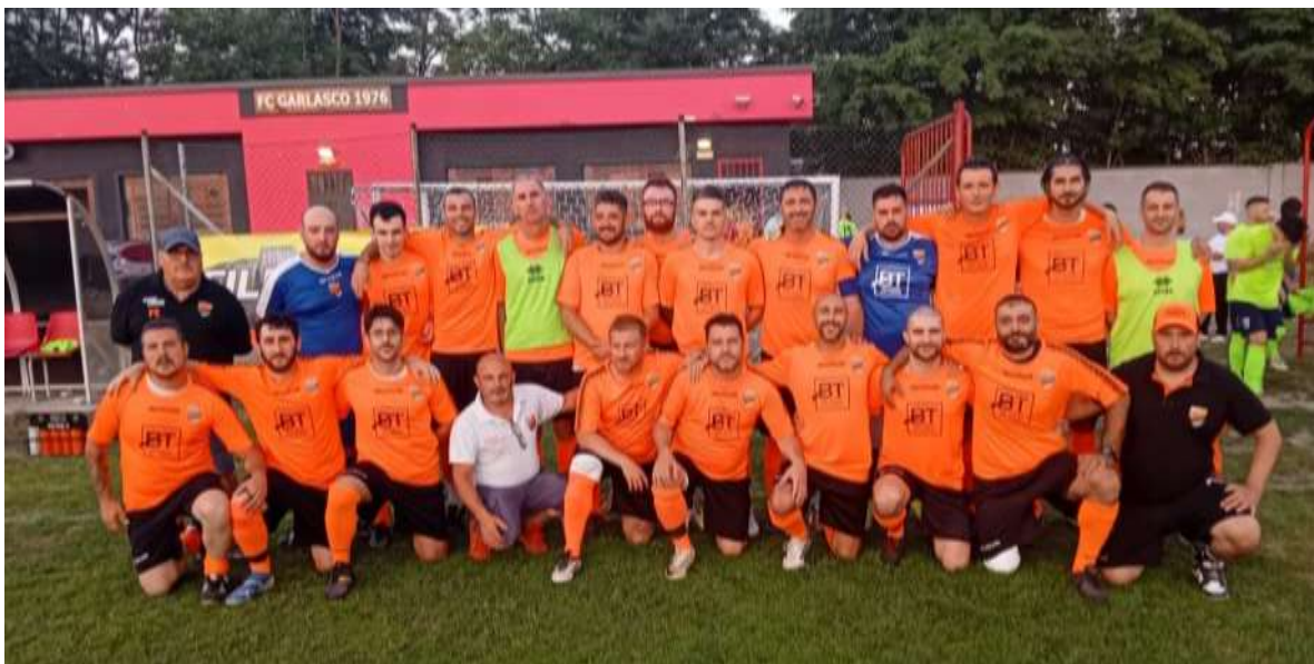
Campionato CSI Pavia 2025-2026 Open 11 - Vice Campione Territoriale - ASD SAN PIETRO