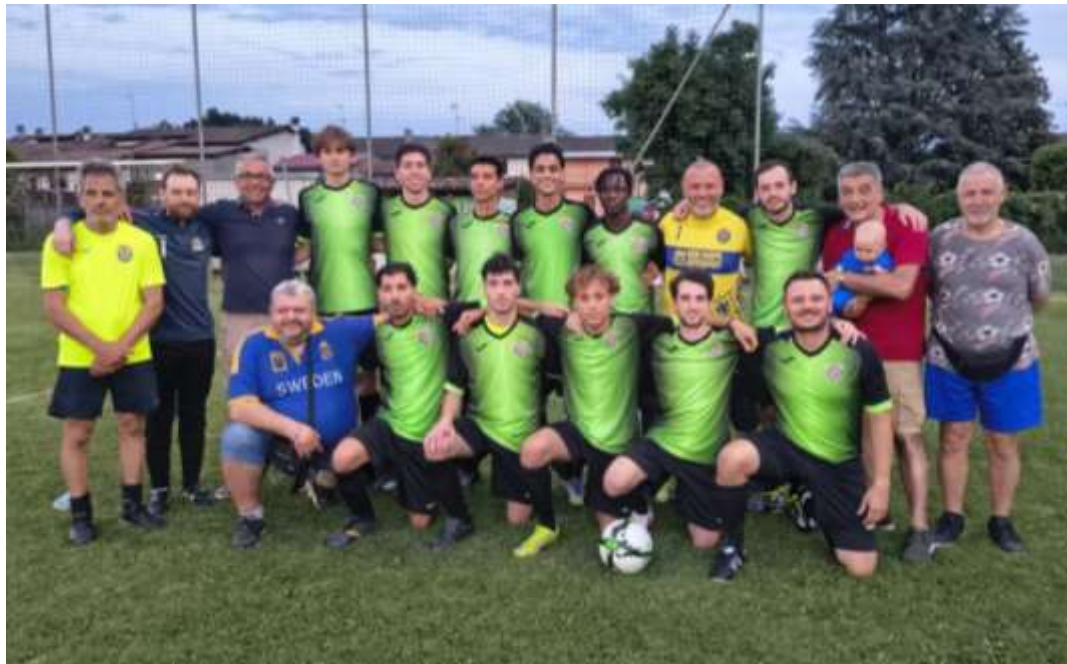
Campionato CSI Pavia 2025-2026 Open 7 - Final Eight - 1° classificata - PARASACCO