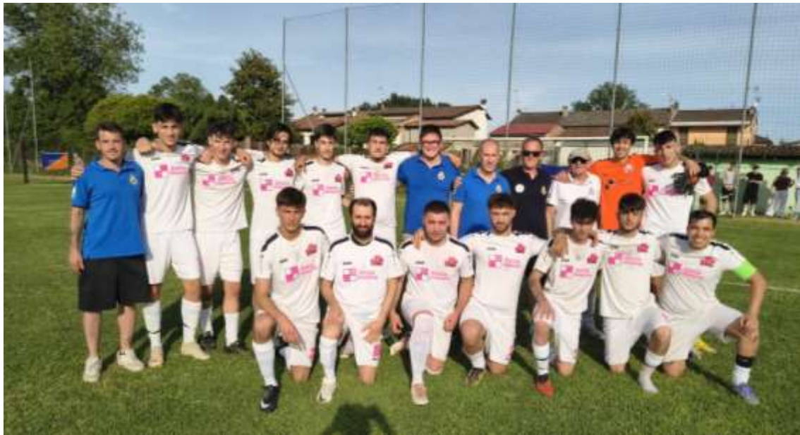
Campionato CSI Pavia 2025-2026 Open 7 - Coppa CSI - 1° classificata - US MAGHERNO