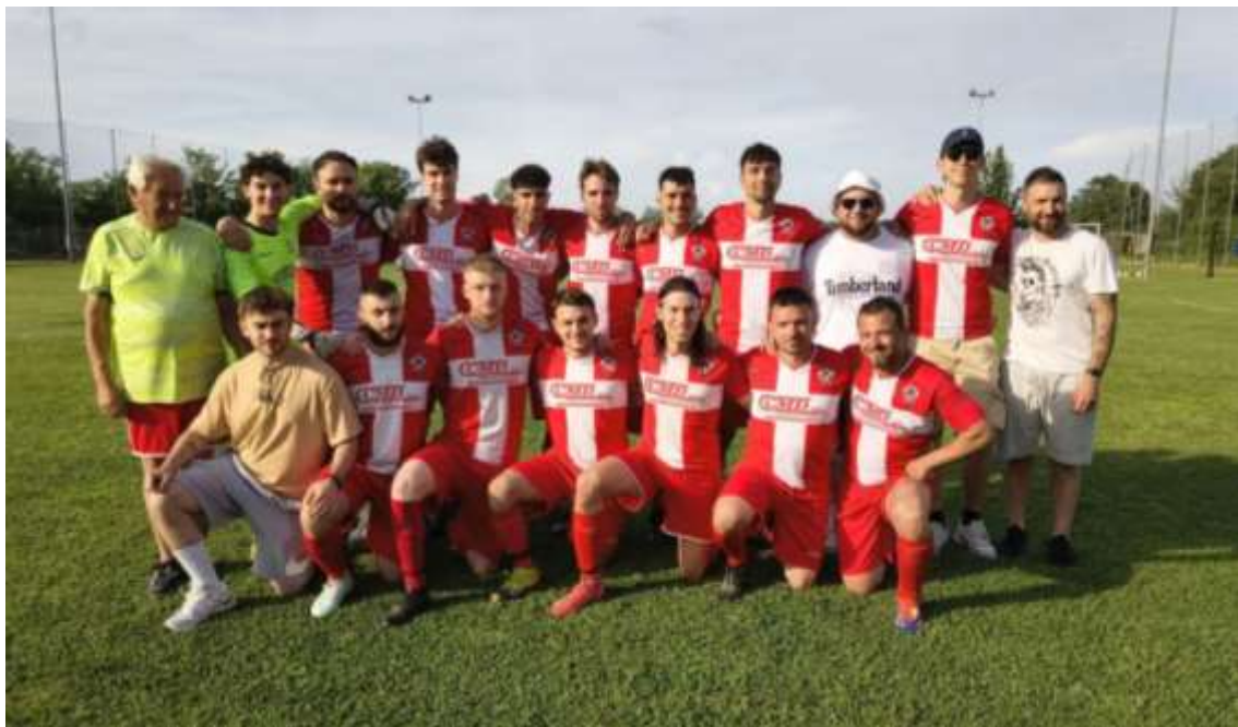
Campionato CSI Pavia 2025-2026 Open 7 - Coppa CSI - 2° classificata - PRO VERRUA