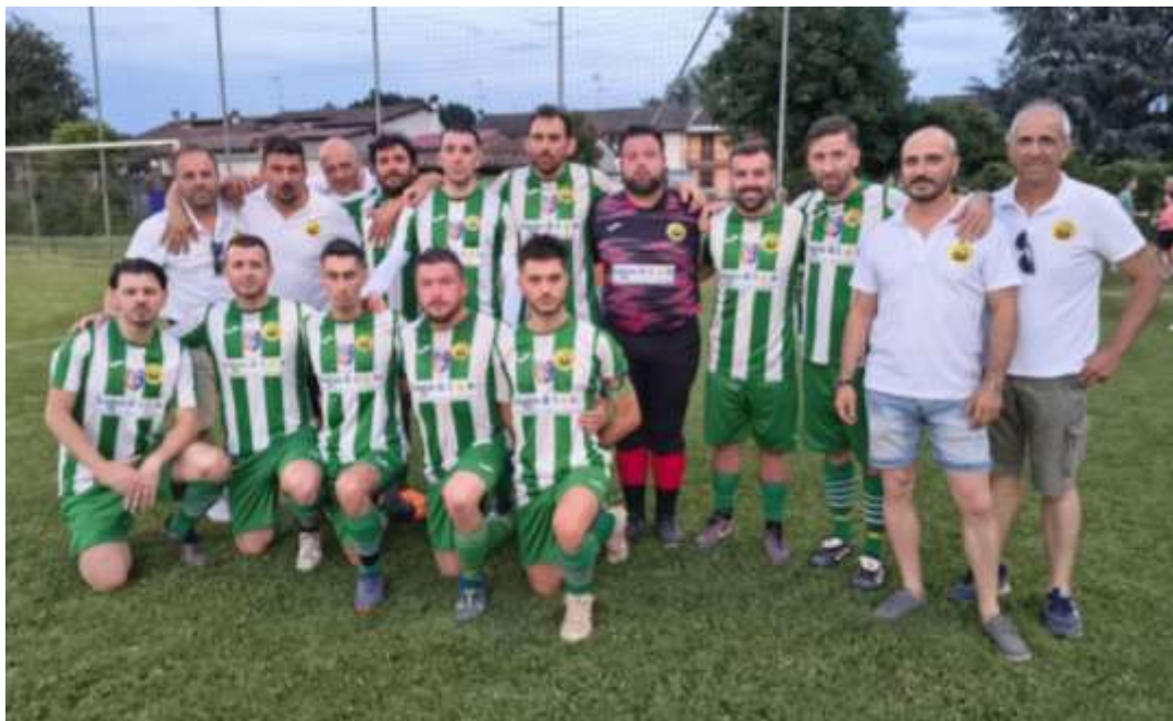
Campionato CSI Pavia 2025-2026 Open 7 - Final Eight - 2° classificata - CASCINE CALDERARI